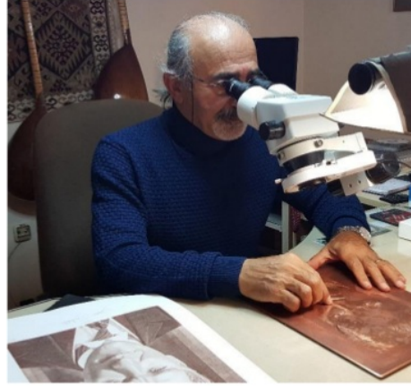
Şekil 3. Şükrü Ertürk bakır levha üzerine Atatürk portresi çalışırken

Merkez Bankaları kendi egemenlik göstergesini en mükemmel şekilde sunabilmek, kültürel ve sanatsal değerlerine atıfta bulunabilmek için sanatçılardan destek almaktadır. Sanatçının tasarımı oluştururken, fazlasıyla sabır, özveri, bilgi ve sanatsal becerisiyle harmanlaması gereken zor bir sürece girmektedir. Aylarca belki yıllarca tasarım çalışmaları devam ettirecek ve tasarımın başlanmasından basım sürecine kadar birebir süreci yönetmesi gerekecektir.