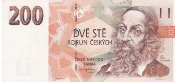
Şekil 2. 200 Korun Çek Cumhuriyeti Banknotu

Merkez Bankaları kendi egemenlik göstergesini en mükemmel şekilde sunabilmek, kültürel ve sanatsal değerlerine atıfta bulunabilmek için sanatçılardan destek almaktadır. Sanatçının tasarımı oluştururken, fazlasıyla sabır, özveri, bilgi ve sanatsal becerisiyle harmanlaması gereken zor bir sürece girmektedir. Aylarca belki yıllarca tasarım çalışmaları devam ettirecek ve tasarımın başlanmasından basım sürecine kadar birebir süreci yönetmesi gerekecektir.