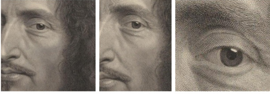
Şekil 2. Robert Nanteuil: Guillaume de Lamoignon, 50.2 × 42.9 cm, 1676. (Detay)

Taille-douce uygulamaları ilk olarak fotoğraf ve film aracılığı ile reproduksiyonların yapılamadığı dönemlerde, ünlü sanatçıların eserlerin çoğaltılması amacıyla kullanılmıştır. Bunun yanı sıra kitaplarda, ansiklopedilerde, ders kitapları gibi yayınlarda resimlemeler gravürlerle yapılmış özel sayfa olarak metnin içine yerleştirilmiştir. Daha sonra posta pulu ve kâğıt para hisse senedi çek bono v.b. kıymetli kâğıtlar 19. yılların başlarında ortaya çıkmaya başladıktan sonra sahteciliğin önüne geçmek için takliti mümkün olmayan taille-douce gravürler kullanıldı.