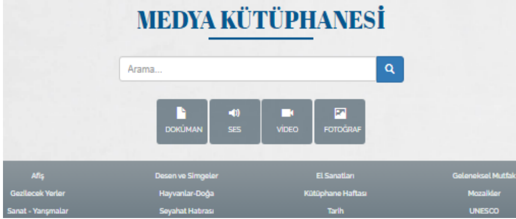
Şekil 3. Kültür Portalı Medya Kütüphanesi (KTB, 2023)

Türkiye kültür portalı, il Kültür ve Turizm Müdürlüklerinden alınan veriler ile çeşitli kamu kurumlarından sağlanan verileri bir araya toplamaktadır. Ayrıca ilgili kurum ve kuruluşlarla imzalanan iş birliği protokolleri kapsamında portalın içerik ve niteliğine uygun çeşitli veriler de elde edilmektedir. Kültür portalının medya kütüphanesi bölümünde arama kısmı da eklenmiştir. Bu portalın ekran görüntüsü Şekil 3'te gösterilmiştir.