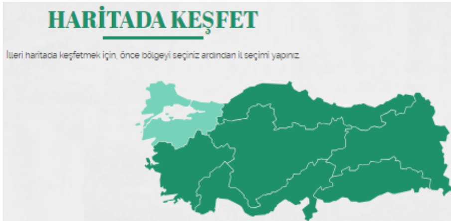
Şekil 4. Türkiye Kültür Haritası (KTB, 2023)

T.C. Kültür ve Turizm Bakanlığı tarafından hazırlanan ve Türkiye'nin doğal ve kültürel mirasını harita üzerinde belirten akıllı bir çevrimiçi tabanlı harita son derece kullanışlıdır. Bu haritada illeri haritada keşfetmek için, önce bölge seçilerek ardından il seçimi yapılmaktadır. Daha sonra o il ile ilgili doğal ve kültürel mirasını yansıtan örnekler sunulmaktadır. Bu harita, sosyal bilgiler dersinde kültürel miras konularının anlatımını destekleyecek inanılmaz bilgiler sunulmaktadır. Ayrıca hem görsel hem de metinsel açıklamalarla son derece dikkat çekicidir. Sosyal bilgiler öğretmenleri kültürel miras konuları ile ilgili etkinlikler tasarlarken veya konuyu anlatırken bu haritadan faydalanabilir. Örneğin bulunduğu ilin "Kültür haritasını belirleyelim" etkinliği başlığıyla öğrencilere araştırmalar yaptırabilir. Öğretmen sınıf içinde akıllı tahtada öğrencilere uygulamalar yaptırabilir. Türkiye kültür haritasının ekran görüntüsü Şekil 4'te belirtilmiştir.