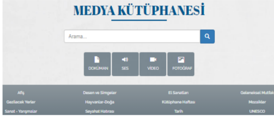
Şekil 2. Kültür Portalı Medya Kütüphanesi (KTB, 2023)