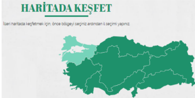
Őekil 3. Türkiye Kültür Haritası (KTB, 2023)

arařtırmalar yaptırabilir. Öğretmen sınıf içinde akıllı tahtada öğrencilere uygulamalar yaptırabilir. Türkiye Kültür Haritasının ekran görüntüsü Őekil 3'te belirtilmiřtir.